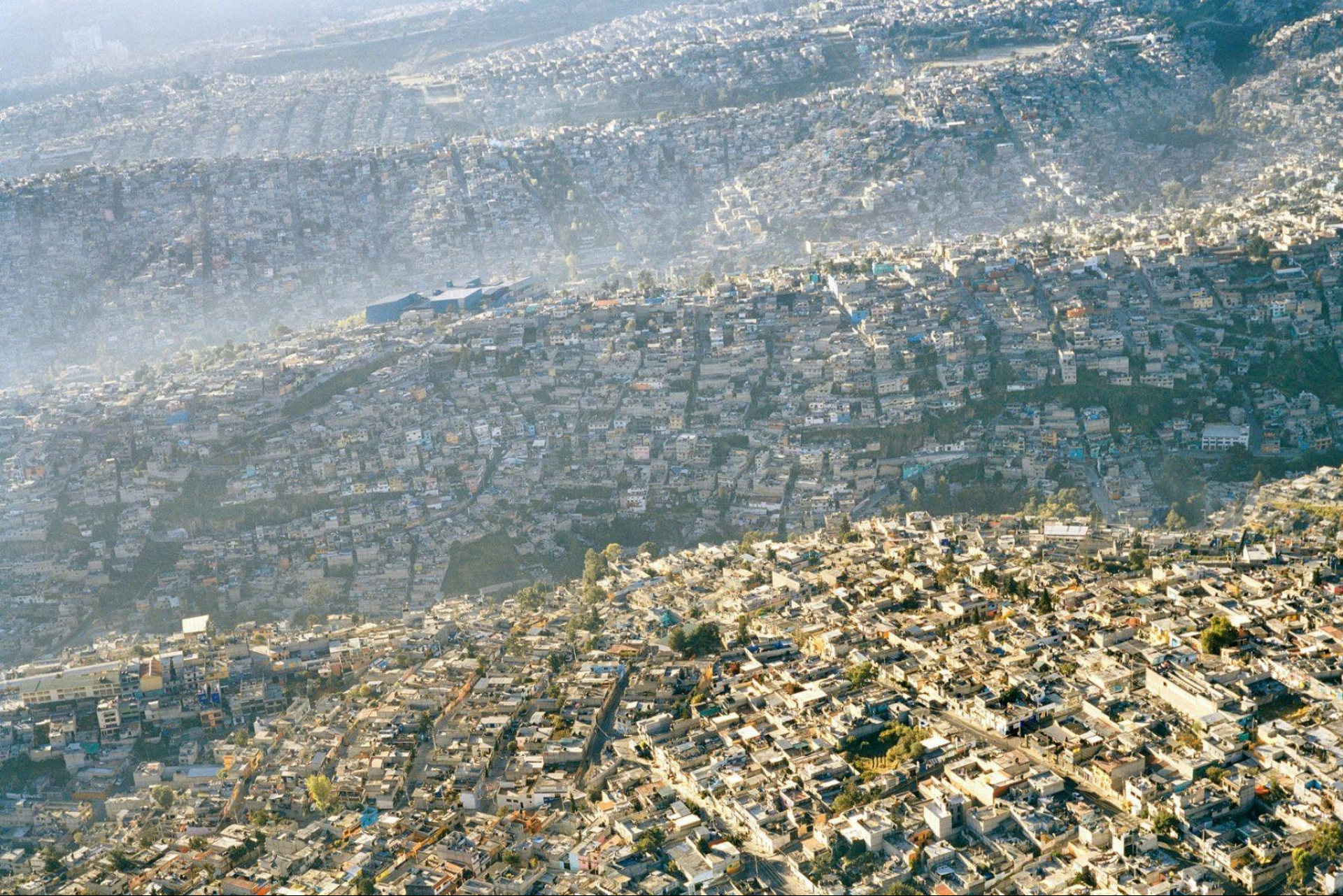
Cidade do México. Fotógrafo: Pablo Lopez Luz