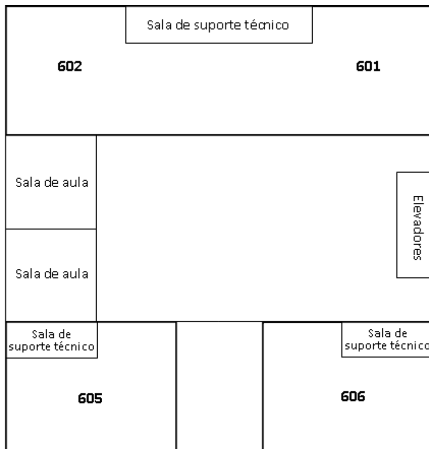
Figura 1: Disposição dos laboratórios no 6º andar do Bloco B - UFABC

A figura 1 apresenta a disposição dos quatro laboratórios molhados dispostos no 6º andar do Bloco B, enquanto a figura 2 apresenta o layout de um dos laboratórios.